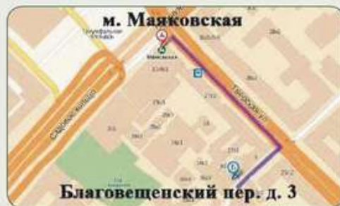
Прием документов м. Маяковская, Благовещенский пер., 3

Юридический адрес: 123001, г. Москва, ул. Б. Садовая, 14 Сайт Военного университета: www.vumo.mil.ru